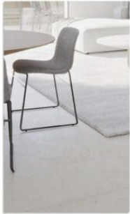
PAVIMENTO GENERAL ACABADOS