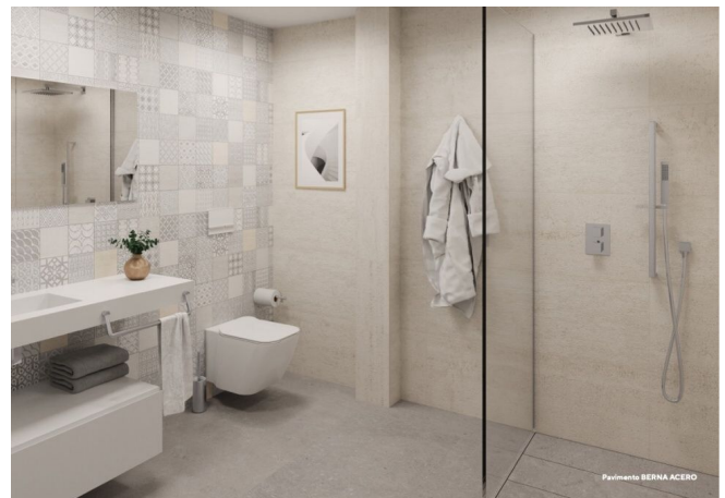
Pavimento BERNA ACERO