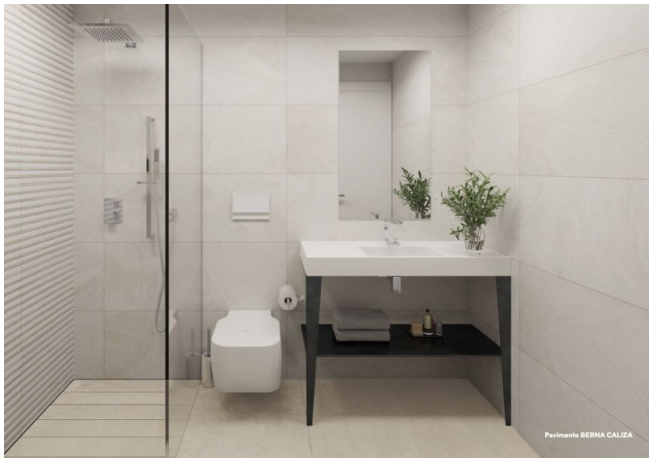
Pavimento BERNA CALIZA